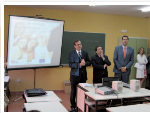
Acto de presentación del Curso celebrado en Zamora, con la presencia del Gerente del ECYL, el responsable de empleo Portugués y el Delegado Territorial de la Junta en Zamora