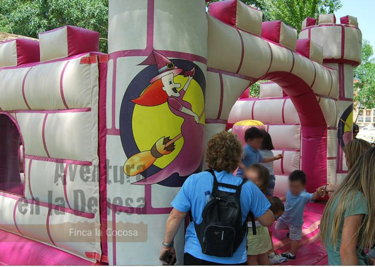
Finca la Cocosa