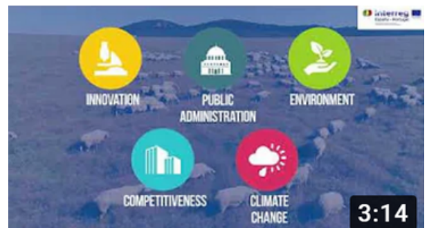
POCTEP Thematics & objectives