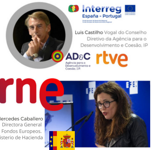
Mercedes Caballero Directora General Fondos Europeos. Ministerio de Hacienda