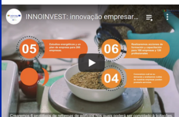
Proyectos / projetos