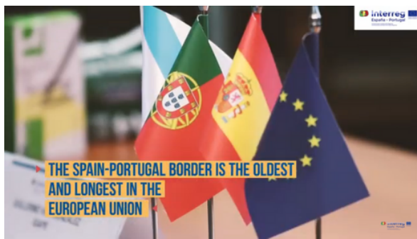
POCTEP 2014-2020 video (English).

- CERVEIRA-TOMIÑO & CHAVES-VERIN EUROCITIES, TECNOLIVO, NAPOCTEP, INTREPIDA, DISCOVER DUERO/DOURO, RDC LA 2020, ACUAENERGY, -