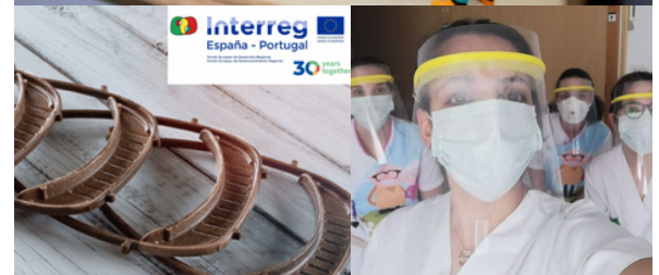
Arriba: proyecto INHOSPITAL, de innovación hospitalaria. Abajo: VALORNATURE y 1234 REDES que, entre otros proyectos, produjeron y donaron EPIS en la etapa más dura de la pandemia.