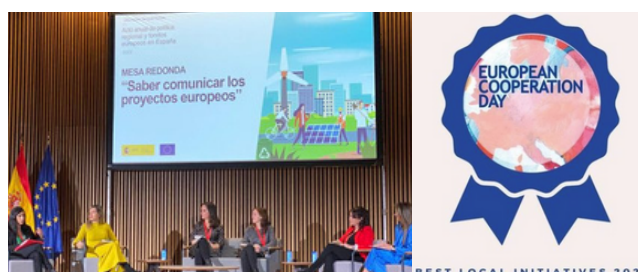
Esquerda: Evento anual da DG Fundos Europeus Direita: Prémio EC Day