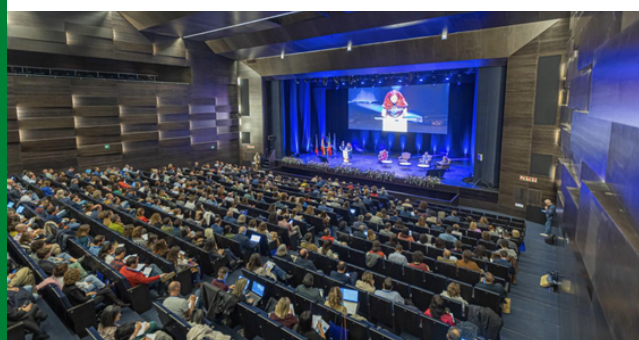
Mais de 700 pessoas assistiram ao evento de lançamento com várias sessões técnicas e de networking em Ayamonte.