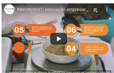
Proyectos / projetos