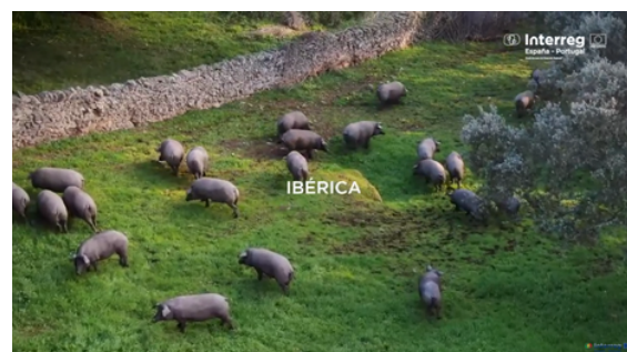
Acima: a série do projeto BIOTRANS sobre o Montado destaca-se pela qualidade da sua produção. Abaixo: o Dark Sky Alqueva, premiado pela terceira vez.

Além disso, receberam prémios como os World Tourism Awards do Dark Sky Alqueva (projeto RDC_LA), ou a distinção como boa prática por parte da UNESCO que receberam os projetos MOVELETUR e GARVELAND .