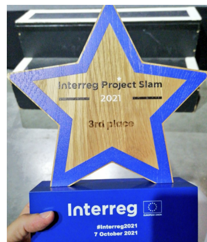
Project Slam: O vídeo POCTEP sobre o despovoamento na Raia foi premiado

Além disso, continuou-se a fornecer informação sobre os projetos POCTEP à Comissão Europeia para a sua divulgação multimédia e difusão no evento anual, na série de Euronews, Stories from the regions e no podcast This is Europe .